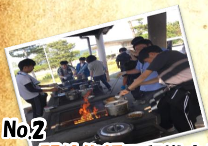
No.2 野外炊飯で和洋中!? ~今夜のメニューは君次第~