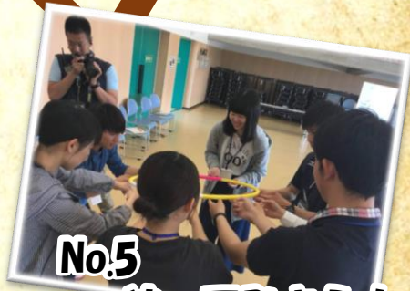
No.5 やってみよう! レクリエーション企画