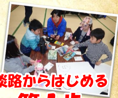
淡路からはじめる 第1歩