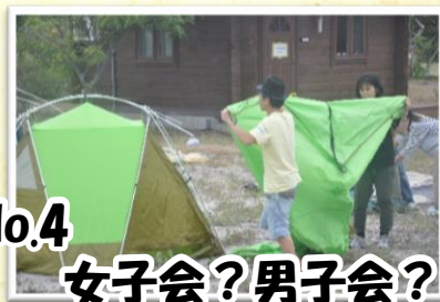
No.4 女子会?男子会? 自然を満喫テント泊