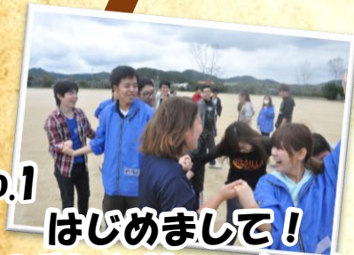
No.1 はじめまして! フチレクリエーション