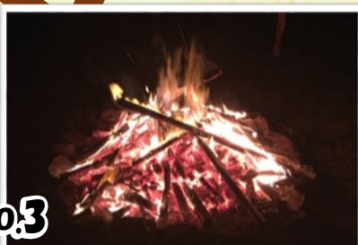
No.3 自然の中でまったりトーク 焼き芋座談会