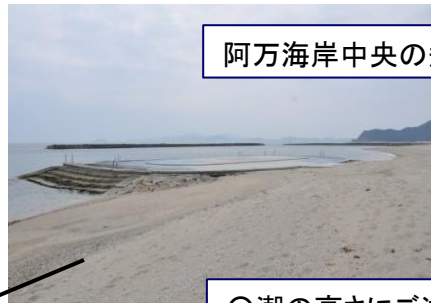
阿万海岸中央の飛び込み台