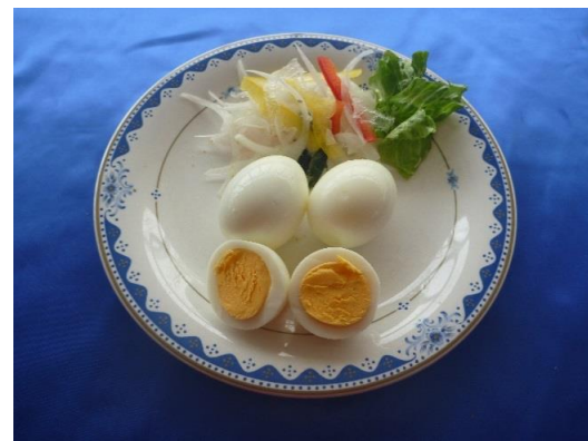
ゆで卵 1ヶ 50円