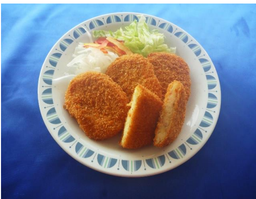
野菜コロッケ 1ヶ 70円