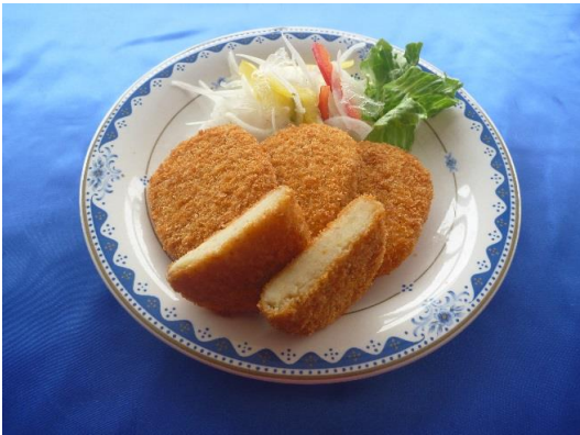
肉入りコロッケ 1ヶ 80円