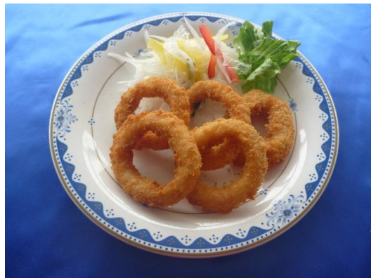
イカリングフライ 2ヶ 80円