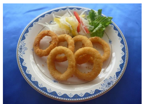
オニオンフライ 2ヶ 80円