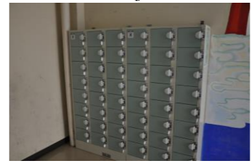
リターン式コインロッカー