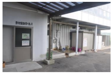
野外炊飯食材受け渡し所