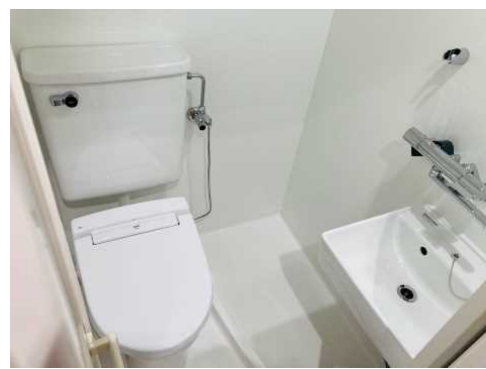
【設備】トイレ/洗面所/ユニットバス