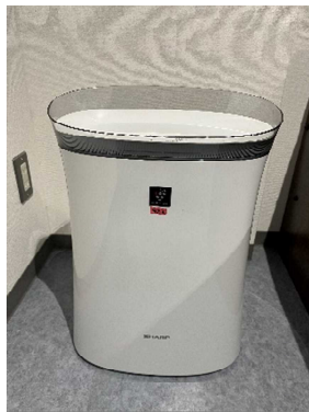
【設備】空気清浄機 1台