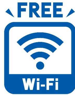
フリーWi-Fi使用できます。